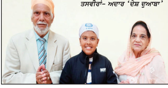
ਤਸਵੀਰਾਂ- ਅਦਾਰ 'ਦੇਸ਼ ਦੁਆਬਾ'